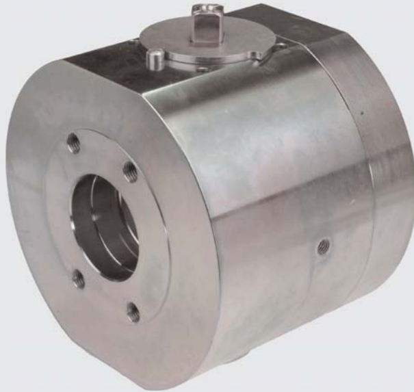
FCKH-U SAE FCKH-U SAE

Gehäuse: S355J2G3, Edelstahl (1.4571/316Ti) Kugel + Schaltwelle: S355J2G3 Dichtungen: POM, PEEK O-Ringe: Viton